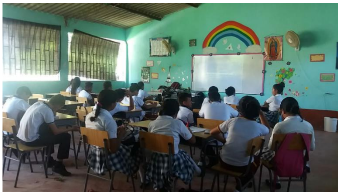
Figura 2. Sesión de aplicación de los cuestionarios en Rovira (Tolima)

participantes/padres o tutores diligenciaron el consentimiento informado y luego los estudiantes completaron los cuestionarios de manera voluntaria (ver Figura 2). Posterior a la aplicación se analizaron los resultados a través del Software Statistical Package for the Social Sciences (SPSS) versión 24.0.