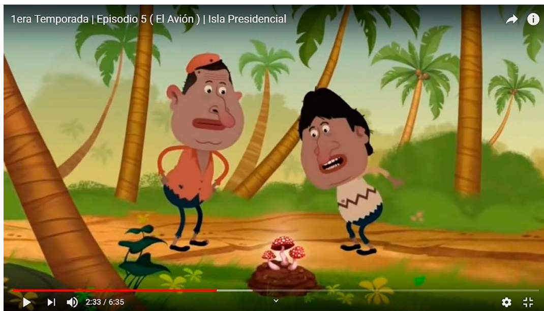
Figura 4. La disputa (Isla Presidencial, Capítulo 5, Temporada 1)

A la izquierda, Hugo Chávez y a la derecha, Evo Morales