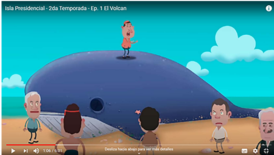
Figura 2. La ballena (Isla Presidencial, Capítulo 1, Temporada 2)

De izquierda a derecha: Daniel Ortega (presidente de Nicaragua), Cristina Fernández (expresidente de Argentina), Sebastián Piñera (presidente de Chile), Rafael Correa (expresidente de Ecuador), Evo Morales (expresidente de Bolivia), Hugo Chávez (expresidente de Venezuela), Juan Carlos I (antiguo Rey de España) y Juan Manuel Santos (expresidente de Colombia).