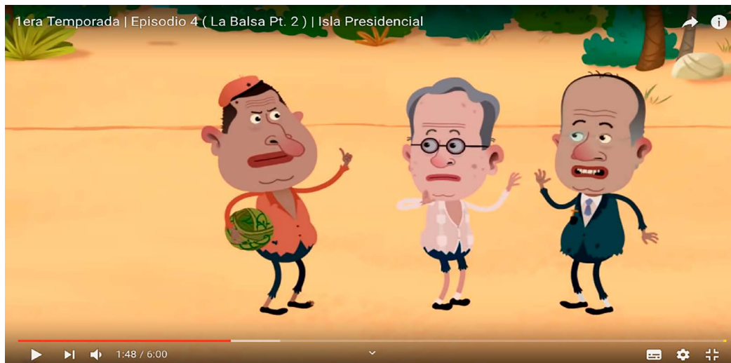
A la izquierda Hugo Chávez, en el centro Álvaro Uribe y a la derecha Felipe Calderón.