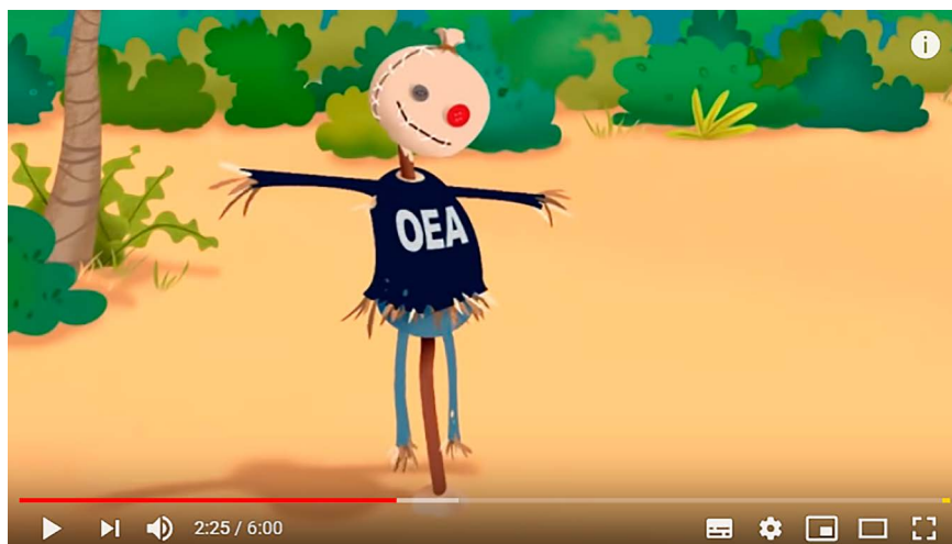
Figura 3. Espantapájaros (Isla Presidencial, Capítulo 4, Temporada 1)

Representación de la Organización de Estados Americanos (OEA)