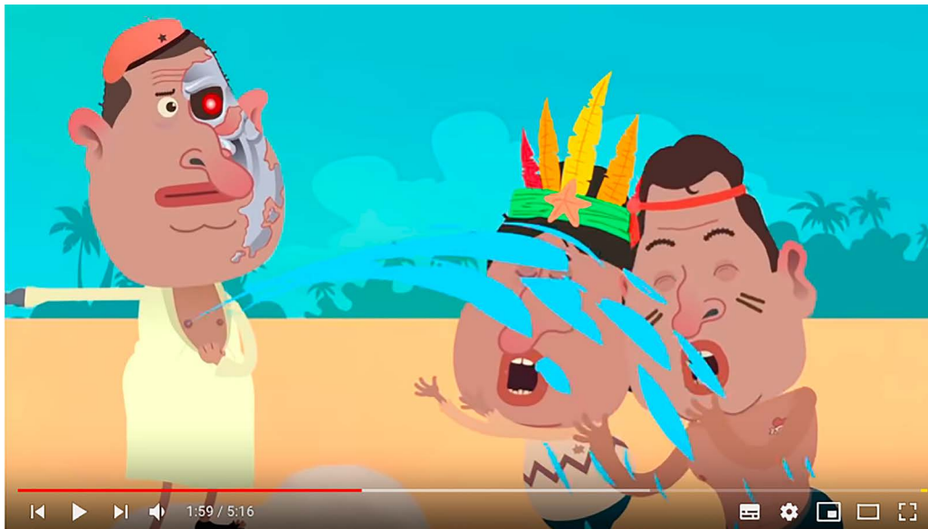
Figura 6. El Mesías Robot. Isla Presidencial, Capítulo 5, Temporada 2.

De izquierda a derecha: Hugo Chávez, Evo Morales, Rafael Correa